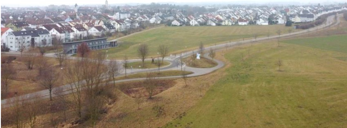
Drohnenluftbild von Tierökologe Dr. Deuschle

In der Gemeinde Gärtringen besteht seit langem eine hohe Nachfrage nach Wohnraum. In diesem Zusammenhang hat die Gemeinde die LBBW Immobilien Kommunalentwicklung GmbH mit der Erstellung eines ganzheitlichen Innenentwicklungskonzeptes beauftragt. Darin wurde unter anderem der Flächen- und Wohnraumbedarf sowie die Potenziale im Bestand bzw. der Innenentwicklung ermittelt. Die im Jahr 2024 vorgelegten Ergebnisse legen dar, dass die Gemeinde einen deutlichen zusätzlichen Wohnraumbedarf bis zum Jahr 2035 hat. Da dieser nicht allein durch die Außenentwicklung gedeckt werden kann, wurden auch Innenentwicklungs- und Arrondierungsflächen hierfür aufgezeigt. Eine dieser Flächen ist A1 „Kayertäle Ost“.